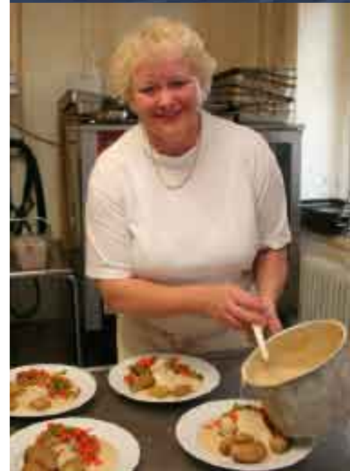
Bildtexter om Herrgården

konstnärers verk inom grafik och skulptur – allt från figurativ konst till mer abstrakta uttrycksformer.