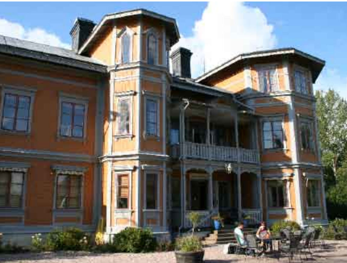
Bildtexter om Herrgården

använde på 50-talet herrgårdens flygelbyggnad som jaktbostad, står det också att läsa i guideboken.