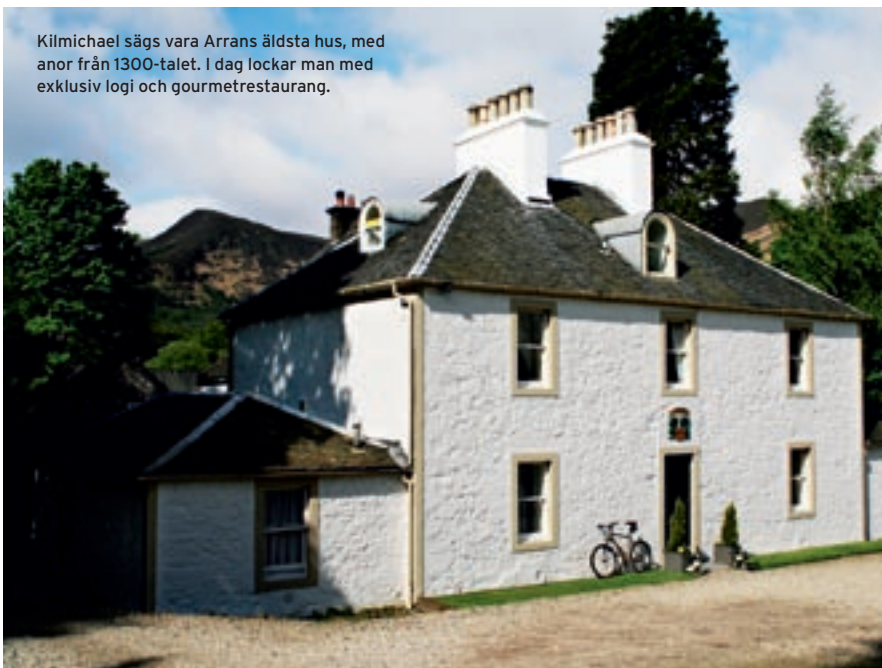
Kilmichael sägs vara Arrans äldsta hus, med anor från 1300-talet. I dag lockar man med exklusiv logi och gourmetrestaurang.