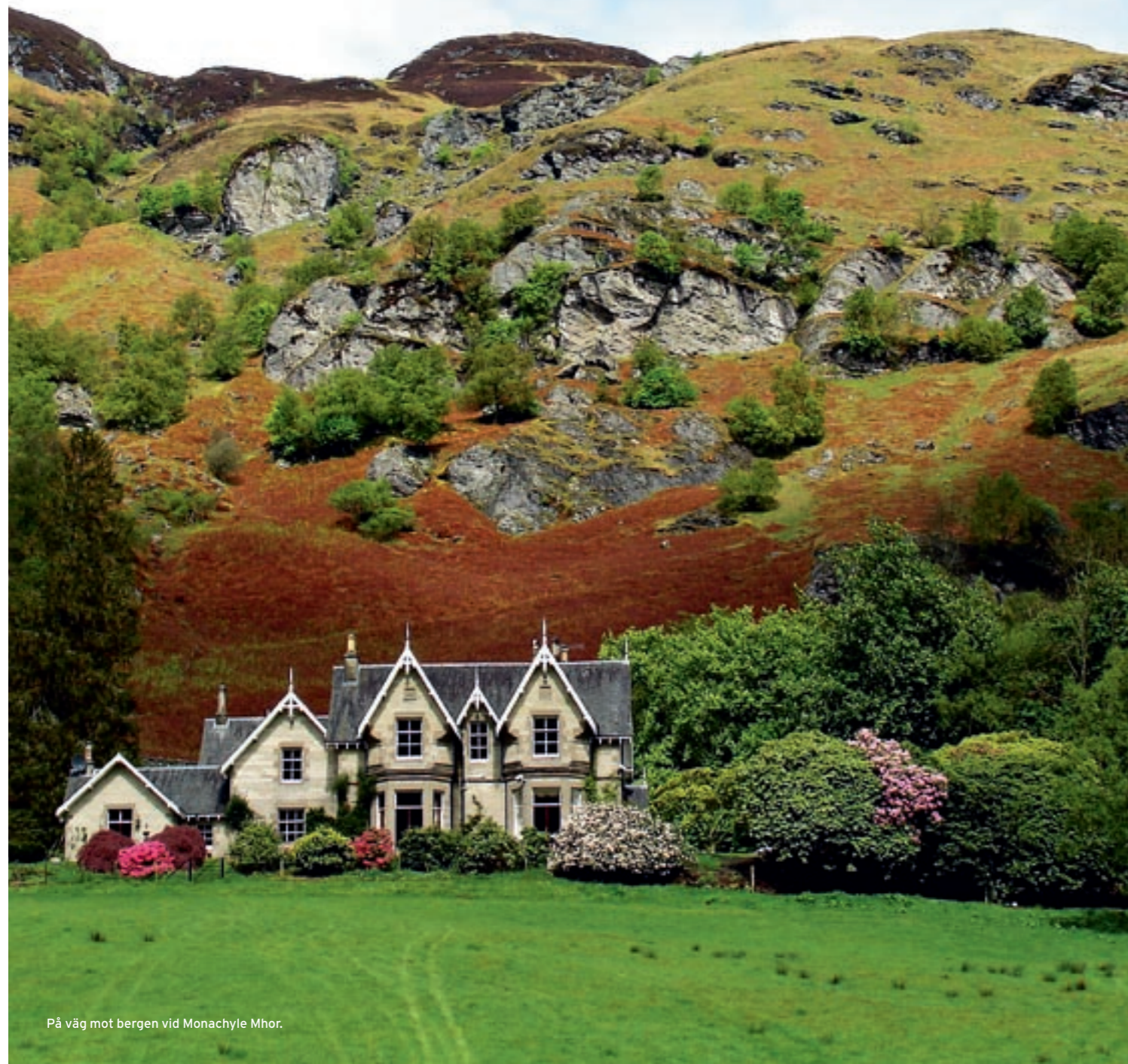
På väg mot bergen vid Monachyle Mhor.

Någonting att äta, någonting att dricka – och lite hisnande landskap till på köpet? I så fall är en cykelsemester i Skottland ett givet val. TEXT OCH FOTO Cenneth Sparby